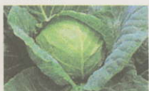
経すくい 阿波市観光協会