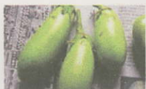
PR-試食 阿波ベジプロジェクト