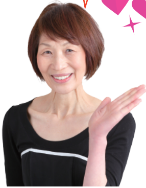
料理研究家：浜内 千波先生