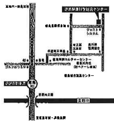
徳島経済産業会館アクセスマップ